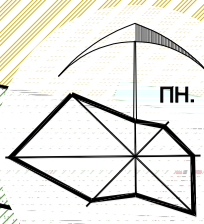
СХЕМА СУЧАСНОГО ВИКОРИСТАННЯ ТЕРИТОРІЇ ТА СХЕМА ІСНУЮЧИХ ОБМЕЖЕНЬ У ВИКОРИСТАННІ ЗЕМЕЛЬ М 1:2000